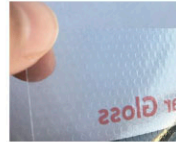
Easy Dot (vinilo de microventosa)

Fabricado en Easy Dot (vinilo de microventosa) de fácil instalación ya que no lleva ningún tipo de adhesivo y se adhiere gracias a la microventosa. Esta diseñado en espejo de tal manera que se coloca por el interior del cristal de la farmacia para verse desde fuera. Tiene tres bolsillos en los que se insertará la hoja DinA4 con la oferta. Esta operación también se realiza por el interior.